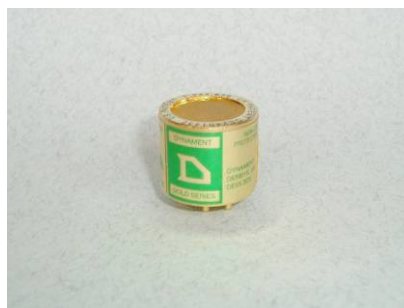
Сменный газовый сенсор (изображение увеличено)