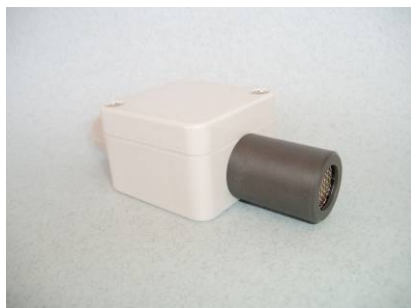
Датчик CR03 радиального типа